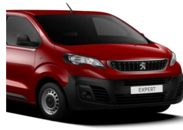
Rød Ardent (X9P0) Speciallak

Leveringsomkostninger: Kr. 4.140,- ekskl. moms.