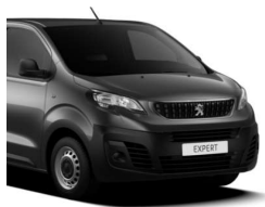
Grå Platinum (VLM0) Metallak