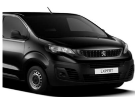
Sort Perla Nera (9VM0) Metallak