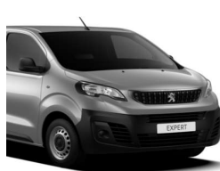
Grå Artense (F4M0)