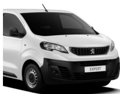
Hvid Banquise (WPP0) Standardlak