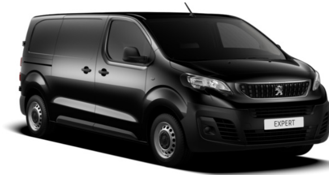
Sort Perla Nera (9VM0) Metallak