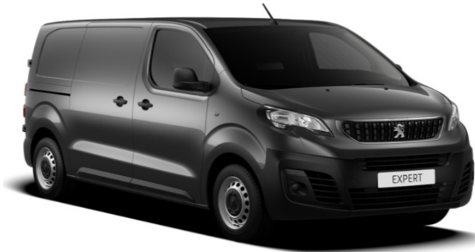
Grå Platinum (VLM0) Metallak