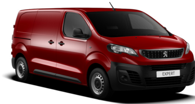
Rød Ardent (X9P0) Speciallak