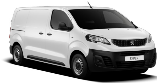
Hvid Banquise (WPP0) Standardlak